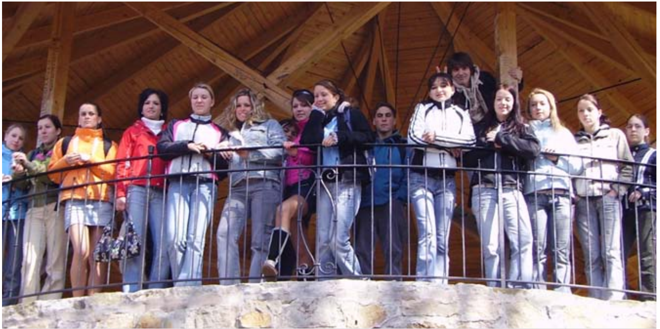
Jazykový projekt Socrates v Poľsku

považujeme fakt, že používaním dvoch rodných jazykov pri príprave publikácie sa nikto nebude cítiť v nevýhode a spoločne sa bude využívať tretí jazyk- anglický.