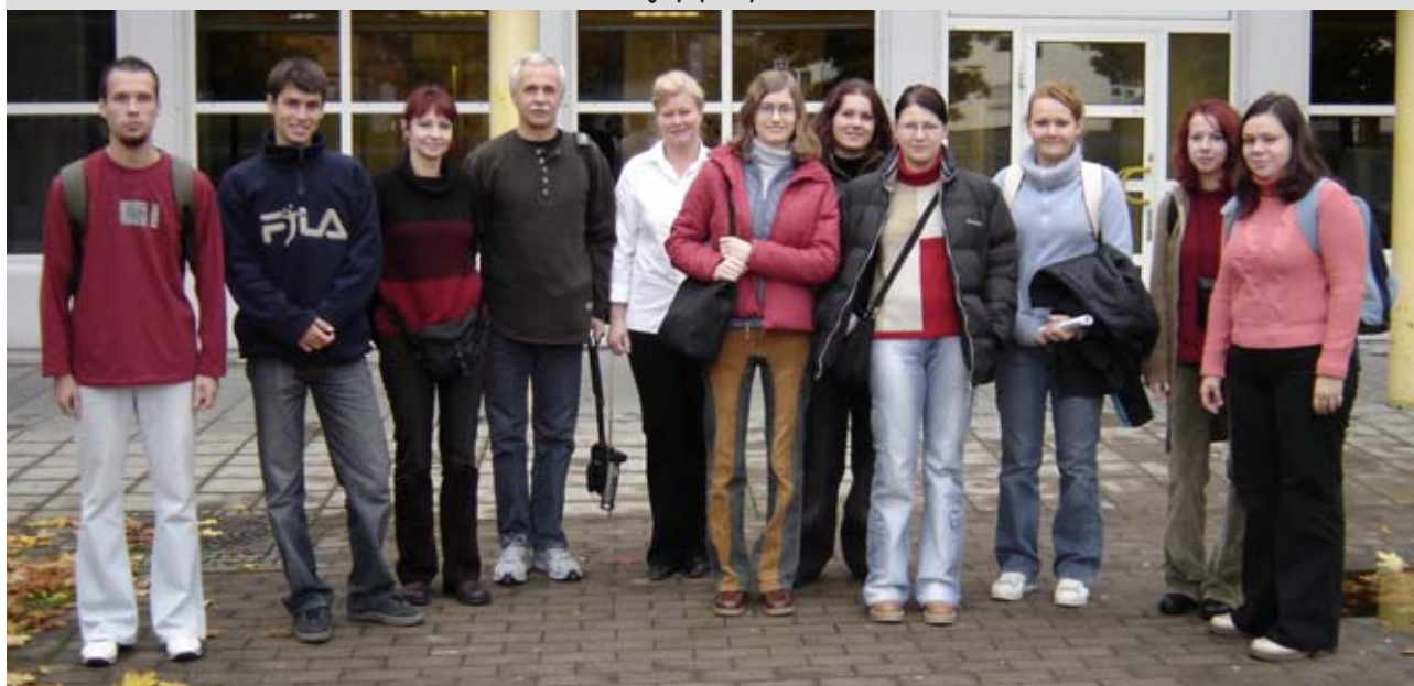
Študijný pobyt v Nórsku

Z hľadiska študentov je dôležitý fakt, že podporíme rozvoj kultúrneho medzinárodného povedomia. Taktiež za dôležitý