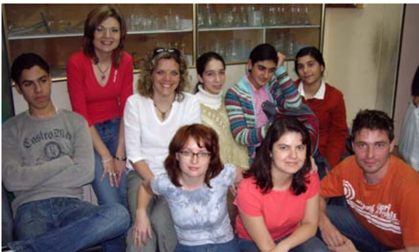
V arabskej škole

Hneď po príchode na letisko ma udivilo veľké množstvo ozbrojených vojakov a policajtov v priestoroch letiska. Z dvadsaťčlennej skupiny si vojaci /neviem z akého dôvodu/ vytypovali mňa, vytiahli ma z davu, ešte som nestihla poriadne ani z lietadla vystúpiť a poobzerat sa okolo seba. Môj pas sa im