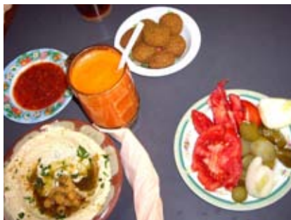
Niečo pod zub

Úradným jazykom je hebrejčina, ale väčšina ľudí nemá problém komunikovať plynule v angličtine. A to nielen v školách, ale aj na uliciach, tržniciach, obchodoch... Keď si vezmeme, že hebrejský jazyk je lingvisticky úplne iný ako anglický, písmo je tiež odlišné a píše sa sprava doľava, je podľa mňa pre izraelských študentov oveľa ťažšie naučiť sa po anglicky v porovnaní s našimi študentami. V niektorých hebrejských učebniciach nájdete základy arabčiny, aby židovské deti poznali aspoň základné dorozumievacie frázy. A takisto arabskí žiaci sa učia po hebrejsky, ale začínajú oveľa skôr. Spoločným prvkom týchto dvoch jazykov je písanie sprava doľava.